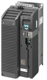
Figura similar / Figure similar