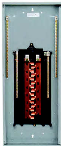
Serie PL monofásico Zapata principal