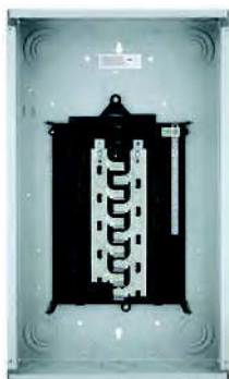
Serie ES monofásico, zapatas principales 125 A, 12-24 circuitos