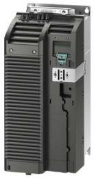
Figura similar / Figure similar