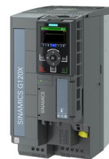
Figura similar / Figure similar