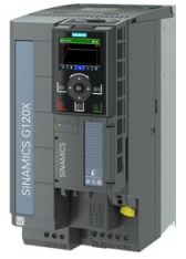
Figura similar / Figure similar